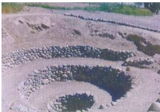
Fig. No.4 Galería de Cantayoc - Acceso