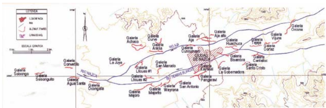
Fig. No.1 Ubicación de galerías filtrantes en el valle de Nazca (Delgado, 2003)

Como se muestra en la Fig. 1, las Galerías se encuentran ubicadas en la zona media alta del valle de Nazca, en una altitud que varía entre los 500 msnm. Y 1000 msnm, en los valles correspondientes a los ríos Aja y Tierras Blancas, tributarios del río Nazca, entre las coordenadas 74^{\circ} 50' - 75^{\circ} 05' de Longitud Oeste y 14^{\circ} 46' - 14^{\circ} 52' de Latitud Sur.