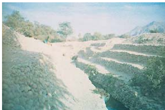
Fig. No.5 Canales de riego con agua proveniente de las galerías