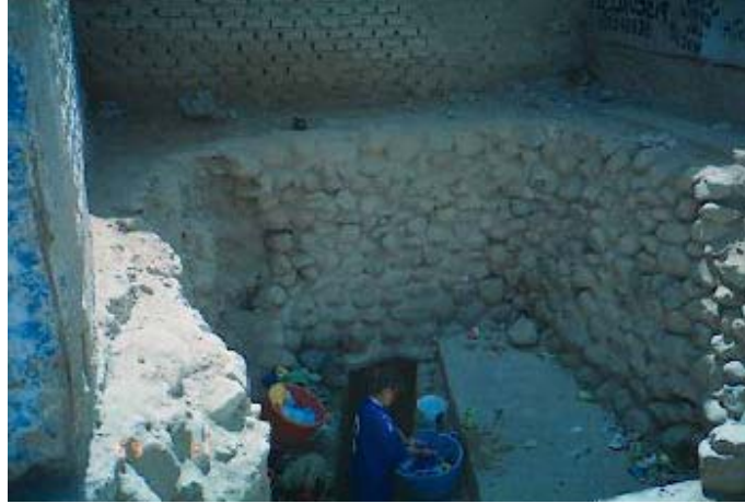
Fig. No.6 Salida de una galería