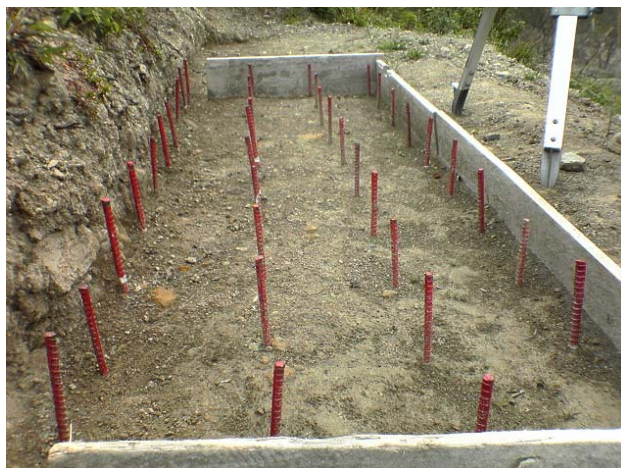
Figura No.1 Dispositivo de medición