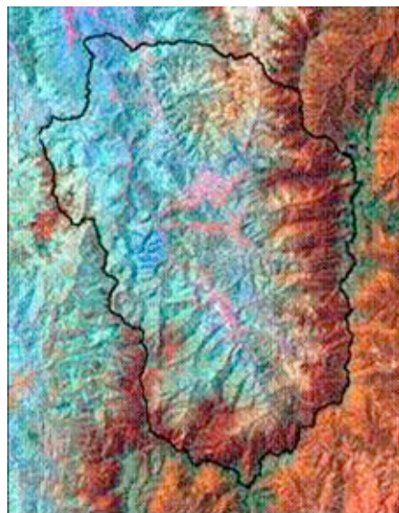
GRAFICO No. 4: Coberturas identificadas